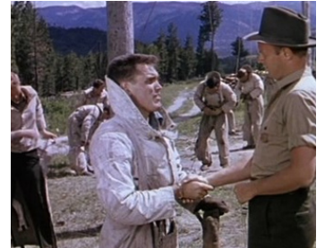
1951 DUEL DANS LA FORÊT (Red Skies of Montana) de J. Newman avec Jeffrey Hunter