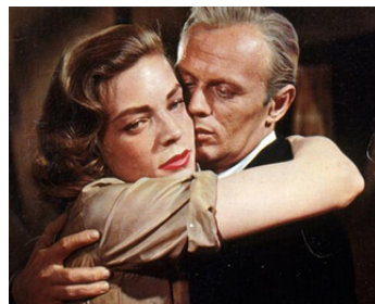
1955 LA TOILE D'ARAIGNÉE (The Cobweb) de Vincente Minnelli avec Lauren Bacall