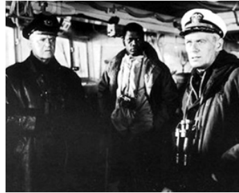
1965 AUX POSTES DE COMBAT (The Bedford Incident) de J.Harris avec E. Portman, S. Poitner