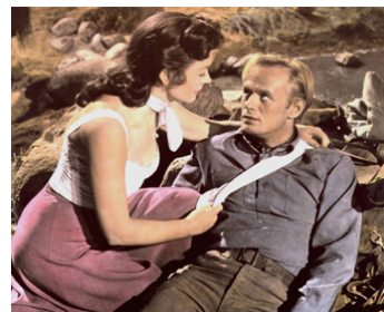
1955 COUP DE FOUET EN RETOUR (Backlash) de John Sturges avec Donna Reed