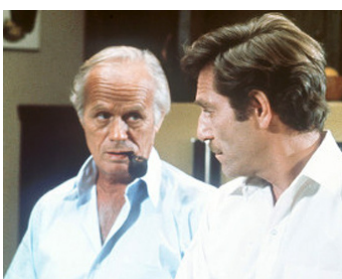
1976 LE TOBOGGAN DE LA MORT (Rollercoaster) de James Goldstone avec George Segal