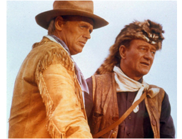
1960 ALAMO (The Alamo) de John Wayne avec John Wayne