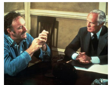
1975 LA THÉORIE DES DOMINOS (The Domino Principle) de S. Kramer avec Gene Hackman