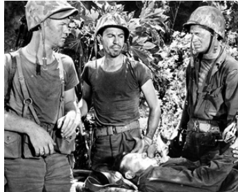
1950 OKINAWA (Hells of Montezuma) de Lewis Milestone avec Martin Millner, Jack Webb