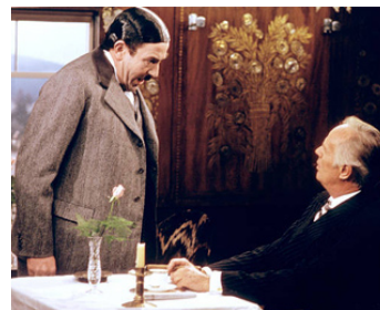
1973 LE CRIME DE L'ORIENT-EXPRESS (Murder on the Orient-Express) de S. Lumet avec A. Finney