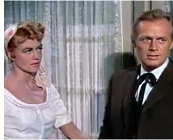
1959 L'HOMME AUX COLTS D'OR (Warlock) d'Edward Dmytryk avec Dorothy Malone