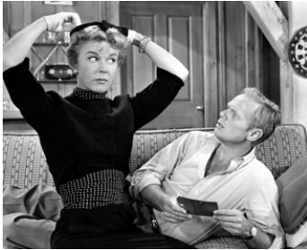
1958 LE PÈRE MALGRÉ LUI (The Tunnel of Love) de Gene Kelly avec Doris Day