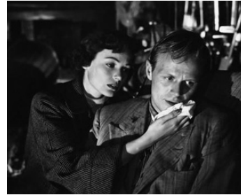
1949 LES FORBANS DE LA NUIT (Night and the City) de Jules Dassin avec Gene Tierney