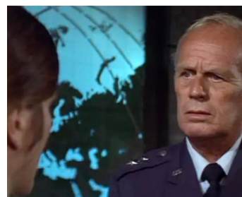
1978 L'INÉVITABLE CATASTROPHE (The Swarm) d'Irwin Allen avec Katharine Ross