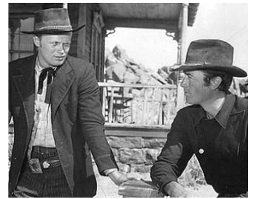
1948 LA VILLE ABANDONNÉE (Yellow Sky) de William A. Wellman avec Gregory Peck