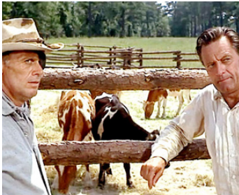
1965 ALVAREZ KELLY (Alvarez Kelly) d'Edward Dmytryk avec William Holden