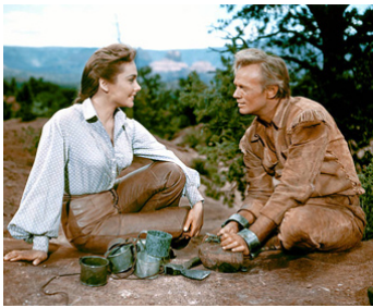
1956 LA DERNIÈRE CARAVANE (The last Wagon) de Delmer Daves avec Felicia Farr