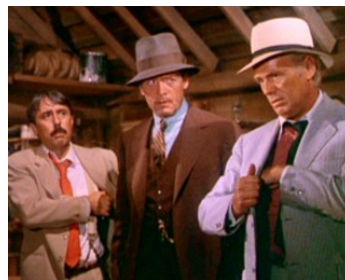
1970 LA GUERRE DES BOOTLEGGERS (The Moonshine War) de R. Quine avec P. McGoonhan