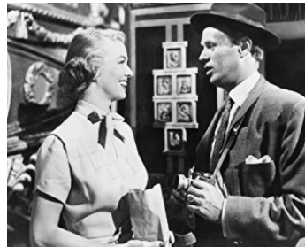
1952 SANS MAMAN (My pal Gus) de Robert Parrish avec Joanne Dru