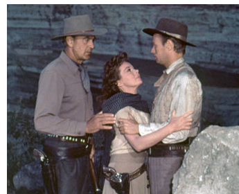
1954 LE JARDIN DU DIABLE (Garden of Evil) de H. Hathaway avec Gary Cooper, S. Hayward