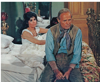
1968 UNE POIGNÉE DE PLOMB (The Death of a Gunfighter) de D. Siegel avec Lena Horne