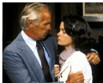
1977 MORTS SUSPECTES (Coma) de Michael Crichton avec Geneviève Bujold