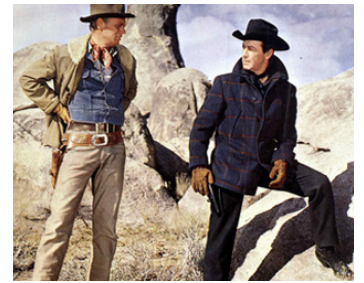
1957 LE TRÉSOR DU PENDU (The Law and Jake Wade) de John Sturges avec Robert Taylor