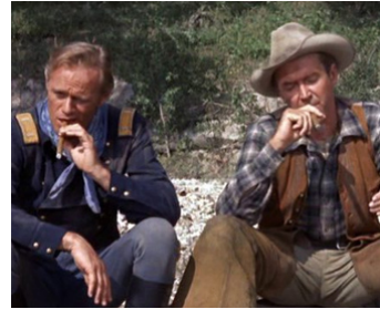
1960 LES DEUX CAVALIERS (Two rode together) de John Ford avec James Stewart