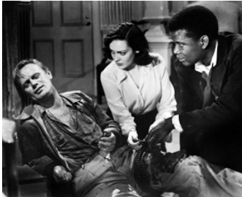
1950 LA PORTE S'OUVRE (No Way out) de Joseph L. Mankiewicz avec Linda Darnell, Sidney Poitier