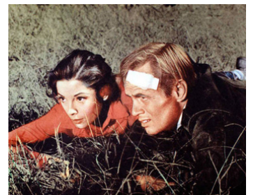
1956 LA COURSE AU SOLEIL (Run for the Sun) de Roy Boulting avec Jane Greer