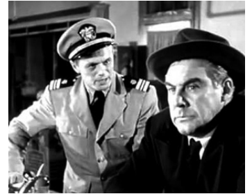
1950 PANIQUE DANS LA RUE (Panic in the Street) d'Elia Kazan avec Paul Douglas