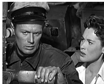
1953 LE DÉMON DES EAUX TROUBLES (Hell and high Water) de S.Fuller avec Bella Darvi