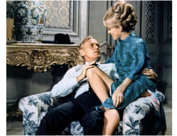
1967 POLICE SUR LA VILLE (Madigan) de Don Siegel avec Inger Stevens