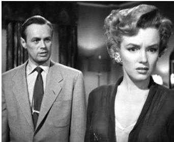
1952 TROUBLEZ-MOI CE SOIR (Don't bother ko knock) de Roy W. Baker avec Marilyn Monroe