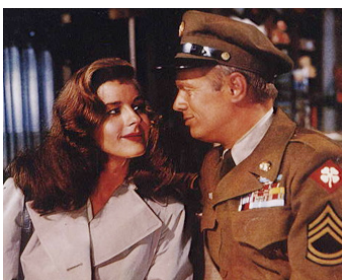
1953 SERGENT LA TERREUR (Take the high Ground !) de R. Brooks avec Elaine Stewart