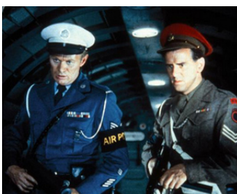
1955 HOLD-UP EN PLEIN CIEL (A Prize of Gold) de Mark Robson avec Garry Edwards