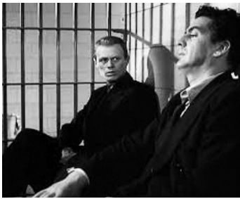
1947 LE CARREFOUR DE LA MORT (Kiss of Death) de Henry Hathaway avec Delmer Daves