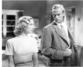
1949 LA FURIE DES TROPIQUES (Slattery's Hurricane) d'A. de Toth avec Veronica Lake