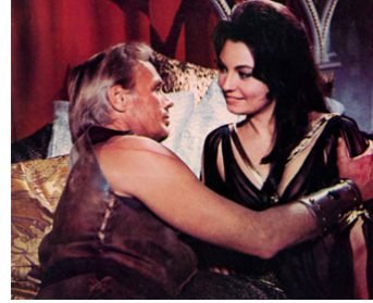
1963 LES DRAKKARS (The Long Ships) de Jack Cardiff avec Rossana Schiaffino