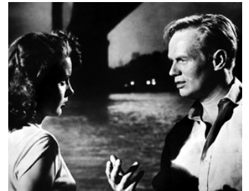
1953 LE PORT DE LA DROGUE (Pickup on South Street) de Semuel Fuller avec Jean Peters