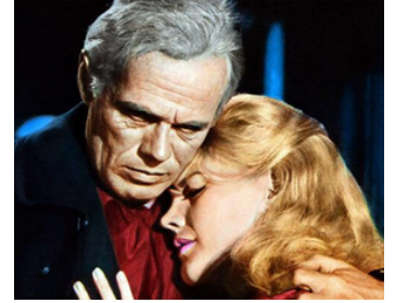
1964 LES CHEYENNES (Cheyenne Autumn) de John Ford avec Carroll Baker