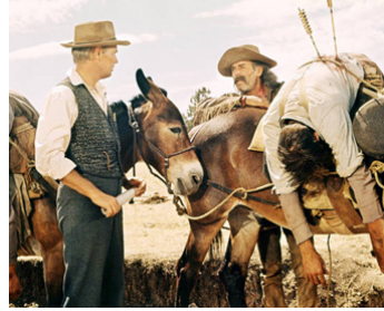
1961 LA CONQUÊTE DE L'OUEST (How West was won) d'H. Hathaway avec Henry Fonda