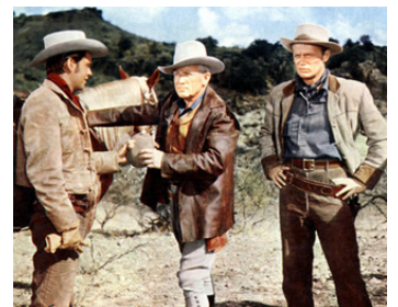
1954 LA LANCE BRISÉE (Broken Lance) d'E. Dmytryk avec R. Wagner, Spencer Tracy