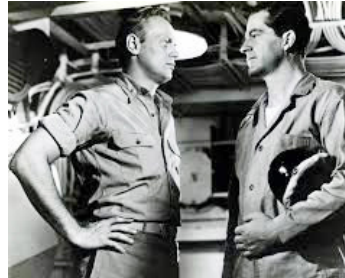
1951 LES HOMME-GRENOUILLES (The Frogmen) de Lloyd Bacon avec Dana Andrews