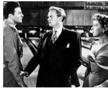
1948 LA FEMME AUX CIGARETTES (Road House) de Jean Negulesco avec C. Wilde, Ida Lupino