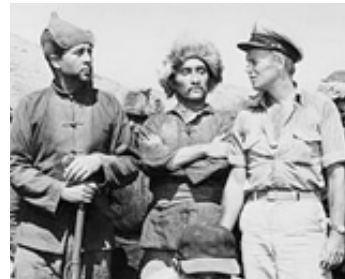
1952 DESTINATION GOBI (Destination Gobi) de Robert Wise avec Don Taylor