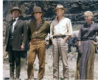
1966 LA ROUTE DE L'OUEST (The Way West) d'A. McLaglen avec K. Douglas, R. Mitchum