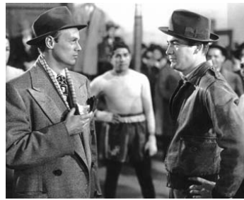
1948 LA DERNIÈRE RAFALE (The Street with no name) de W. Keighley avec Mark Stevens