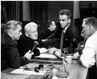
1961 JUGEMENT À NUREMBERG (Judgment at Nuremberg) de S. Kramer avec S. Tracy, M. Clift