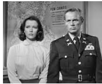
1957 LA CHUTE DES HÉROS (Time Limit) de Karl Malden avec Dolores Michael