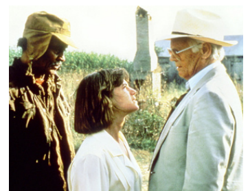
1986 COLÈRE EN LOUISIANE (A Gathering of Old Men) de V. Schlöndorff avec Holly Hunter