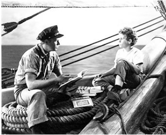
1949 LES MARINS DE L'ORGUEILLEUX (Down to the Sea in Ships) de H. Hathaway avec Dean Stockwell